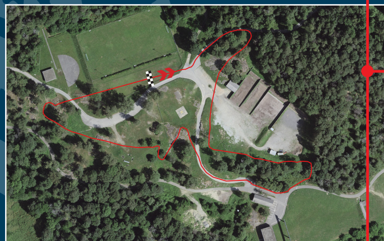
XCC TRACK (KM 0.867)